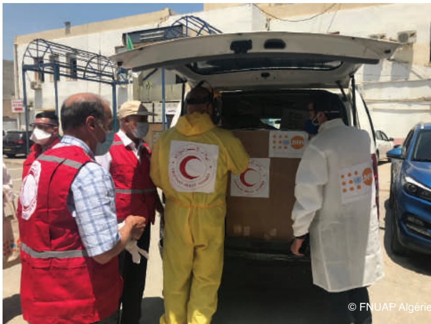
Figure 2: Distribution par le Croissant Rouge Algérien de kits PPE fournis par le FNUAP

du service de gynécologie-obstétrique de l'Hôpital de Médéa couvrant ainsi les wilayas avoisinantes telles que Blida, Tipaza et Ain-Defla (8 juillet 2020).