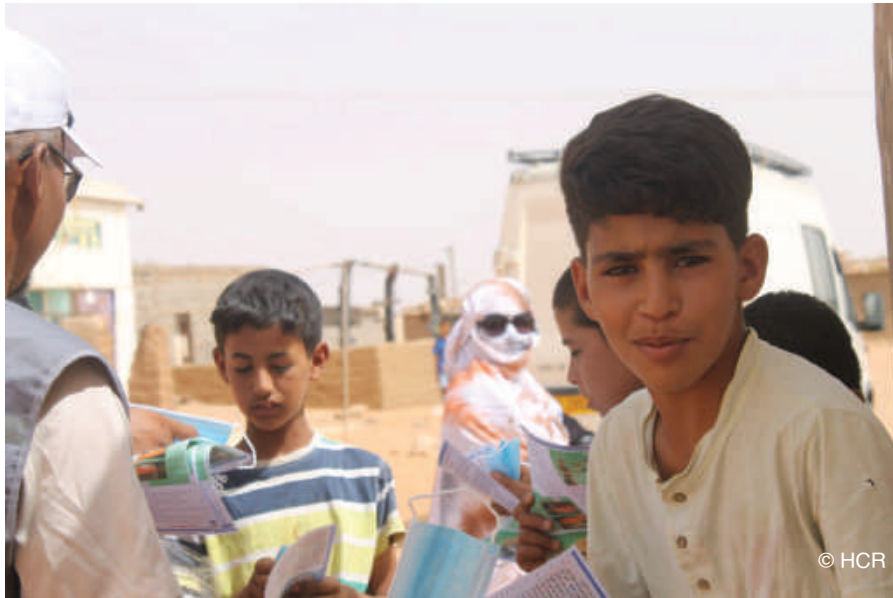
Figure 5: Sensibilisation à l'utilisation du masque et gestes barrières dans les camps de réfugiés de la province de Tindouf