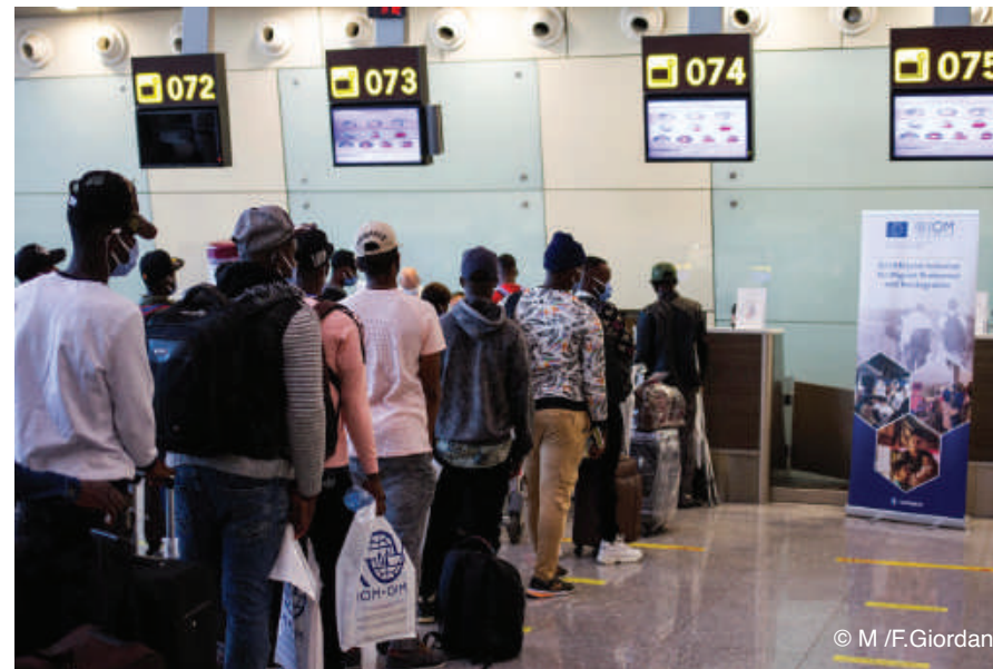
Figure 4: Retour volontaire de migrants de Guinée, de Cote d'Ivoire et du Libéria organisé par l'OIM en collaboration avec le Gouvernement algérien et les pays d'origine

Deux vols spécifiques pour le retour volontaire (VSRV) des migrants bloqués en Algérie dans leurs pays d'origine ont été organisés, respectivement le 14 juillet et le 31 août : le premier, au profit de 84 migrants originaires du Mali; et le second, au profit de 114 bénéficiaires originaires de Guinée, de Côte d'Ivoire et du Liberia. Les vols spécifiques ont été organisés en étroite collaboration avec le Gouvernement Algérien et les gouvernements des pays d'origine, et ont permis aux migrants, dont des enfants non-accompagnés et des femmes seules, cheffes de ménage, avec enfants, de retrouver leurs familles.