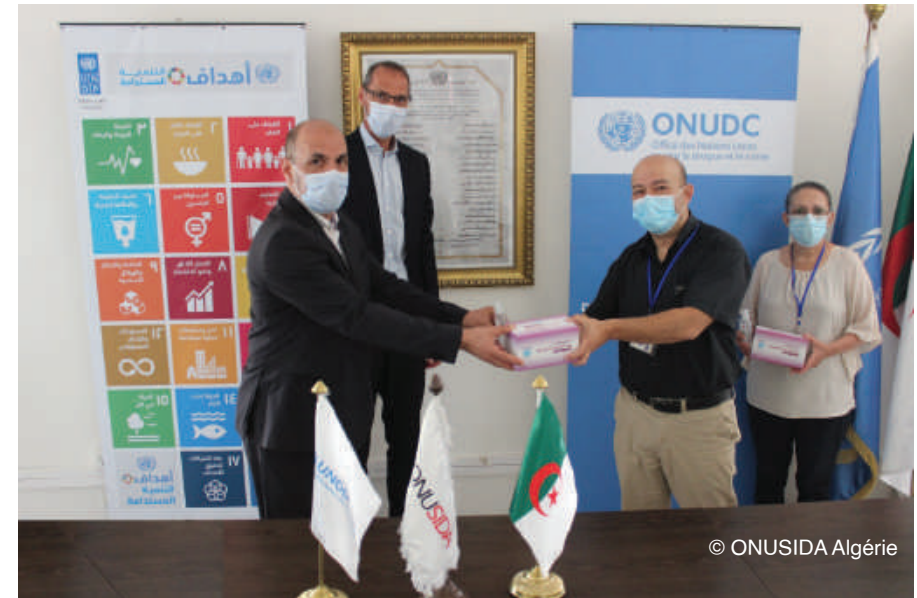
Figure 3: Remise de kits de protection contre la Covid-10 aux ONG

L'ONUSIDA a coordonné avec l'UNODC l'appui au Ministère de la Santé et aux ONG pour la fourniture de produits de protection et de moyens de communication pour la continuité des services de prévention combinée du VIH auprès des usagers de drogues injectables (UDI).